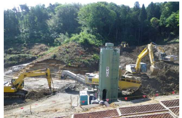
矢田道路その7工事現場

・城山高架橋上部その1工事現場の概要について説明 (PC片持箱桁製作工の実施状況を見学) (25分程度)