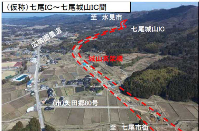
七尾IC(仮称)から七尾城山ICを望む