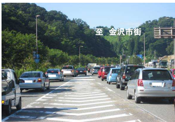
【東長江の混雑状況】 (富山方面から金沢市街方面を望む)