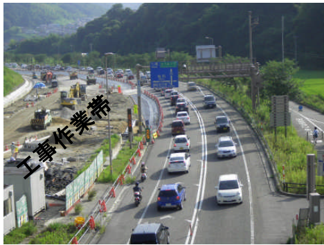
卯辰トンネルより東長江方面を望む