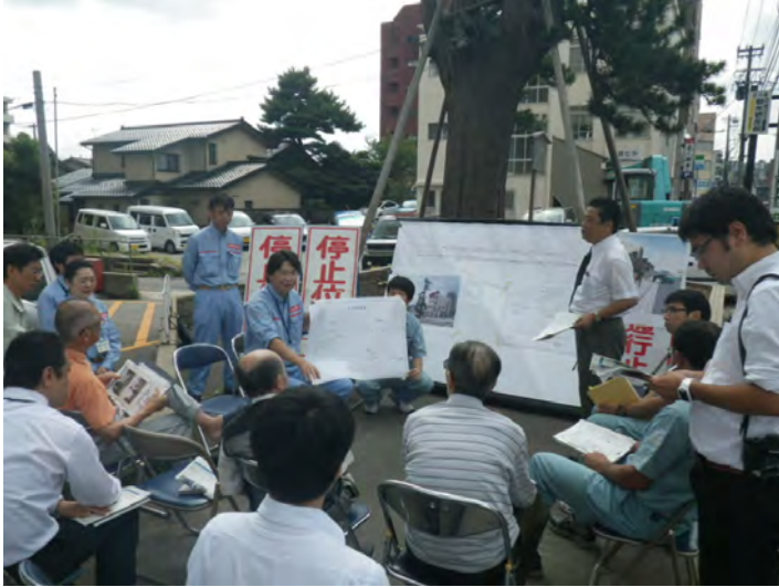
コウヤマキを間近に見ながら意見交換会を実施。