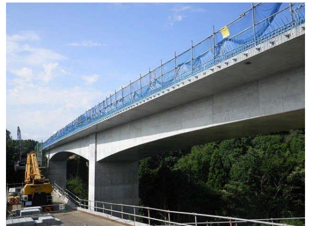
黒崎川橋（8月10日撮影）

※取材を希望される方は、現場への進入制限がありますので事前に問い合わせ先までお申し込み下さい。