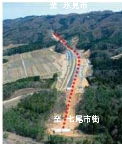
七尾城山ICから七尾大泊IC方面を望む

七尾氷見道路は、能越自動車道の一部を構成し、七尾市八幡「七尾IC(仮称)」～富山県氷見市大野「氷見IC」に至る、高規格幹線道路網の形成、重要港湾七尾港・国際拠点港伏木富山港へのアクセス強化、国道160号の事前通行規制区間等の迂回を目的とした道路事業であり、そのうち七尾IC(仮称)～富山県境までの13.6kmを当事務所が担当しています。