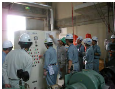
平成23年6月15日の安産川排水機場での訓練状況