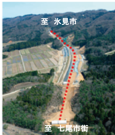
七尾東IC(仮称)から大泊IC(仮称)を望む

七尾氷見道路は、能越自動車道の一部を構成し、七尾市八幡「七尾IC(仮称)」～富山県氷見市大野「氷見IC」に至る、高規格幹線道路網の形成、重要港湾七尾港・国際拠点港伏木富山港へのアクセス強化、国道160号の事前通行規制区間等の迂回を目的とした道路事業であり、そのうち七尾IC(仮称)～富山県境までの13.6kmを担当しています。