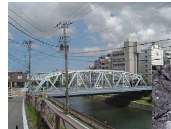
犀川大橋と 犀川沿いの桜並木