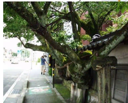
松月寺の大桜 (国指定天然記念物)