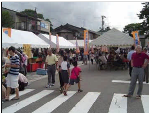
街道まつりの様子

日時 平成23年9月18日(日) 10時～14時 ※雨天決行 開催場所 金沢市野町3丁目 六斗広見 主催団体 六斗広見街道まつり実行委員会