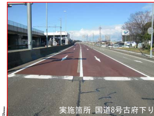
カラー舗装イメージ