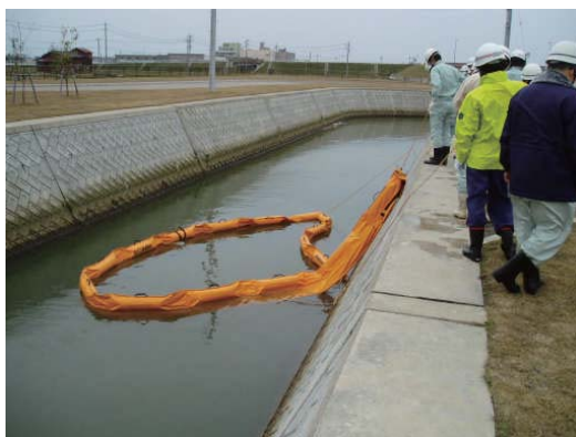
昨年度の訓練実施状況