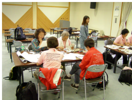
平成21年度、砂防施設の看板をデザイン