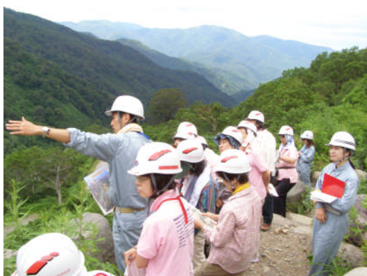
平成21年度、甚之助谷での現場説明