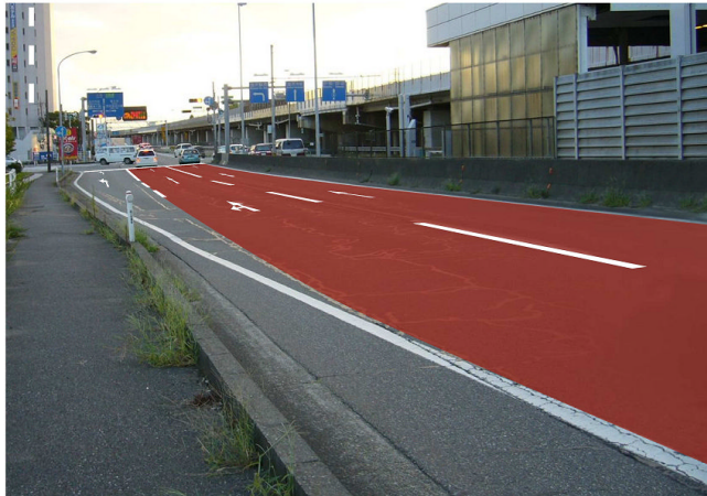
古府交差点手前のカラー舗装イメージ （白山市方面を望む）