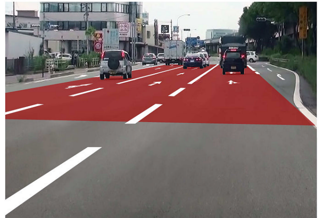
諸江交差点手前のカラー舗装イメージ （白山市方面を望む）