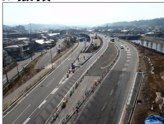
卯辰トンネルから鈴見高架橋を望む