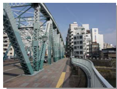
△完成イメージ写真