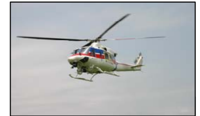
防災ヘリグループ