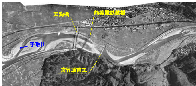
昭和30年頃【砂礫河床】