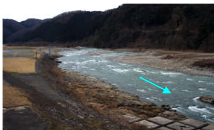
H20年度施工後の状況 (H21.3撮影)