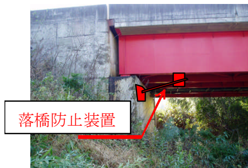
【落橋防止装置設置箇所】