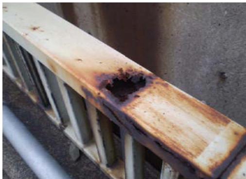
【写真1：鋼製高欄の腐食状況】