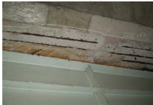
【写真2：床版の剥離・鉄筋腐食状況】