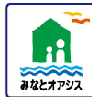
「みなとオアシス」標章

◇現在、全国で43地域登録(北海道地方:1地域、東北地方:10地域、北陸地方:5地域、関東地方:3地域、中部地方:3地域、近畿地方:1地域、中国地方:5地域、四国地方:9地域、九州地方:6地域 H21年2月16日時点(仮登録8地域))