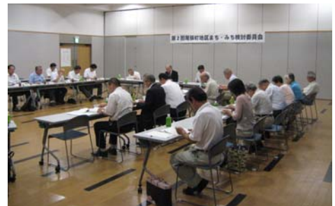
第2回尾張町地区まち・みち検討委員会

●検討内容 ①交通量調査結果について ②アンケート調査結果について ③現状・課題の整理と今後の方向性について