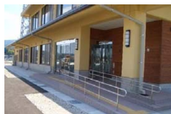
②バリアフリーで開放的な玄関ホール