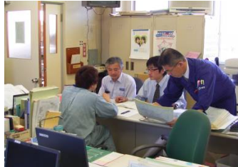
⑤地域の道路相談窓口