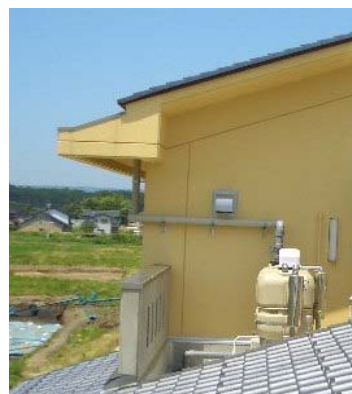
①環境に配慮した雨水タンク