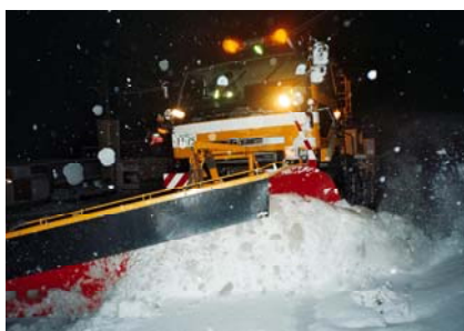
除雪トラックによる除雪状況