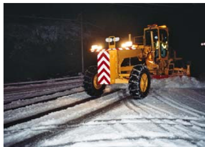
除雪グレーダによる除雪状況

※気象予報を基に設定していますが、気象条件により延期する場合がありますのでご了解願います。