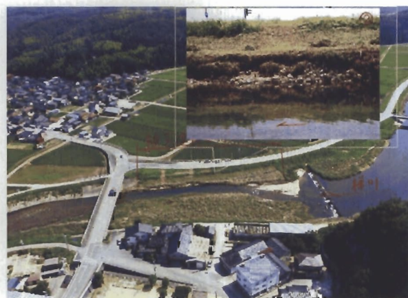
梯川被災箇所（護岸欠損） 石川県小松市中海町地先