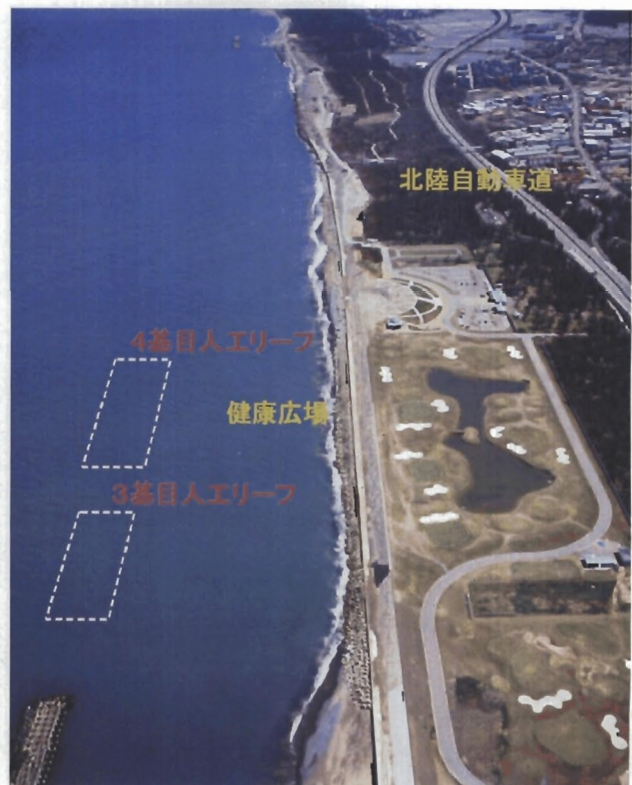
平成19年度実施箇所