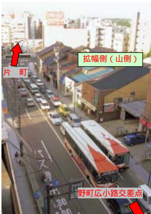
片町から野町広小路交差点の渋滞状況

平成17年度は、 のまちひろこうじ 犀川大橋から野町広小路交差点間の山側を拡幅し、片町方面から増泉（金沢西IC）方面への右折車線の2車線化による渋滞対策と良好な歩行空間の確保を目的に歩道拡幅、電線類の地中化、冬期バリアフリー対策としての歩道内融雪装置の整備を予定しています。なお、平成18年度以降、引き続き海側の整備を行う予定です。