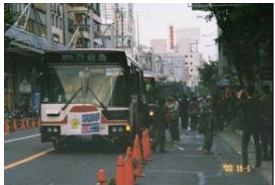
「トランジットモール」社会実験 (岐阜県岐阜市)