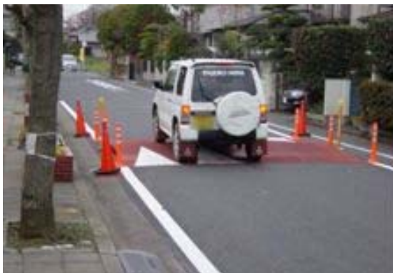
「くらしのみちゾーン」社会実験 (千葉県鎌ヶ谷市)