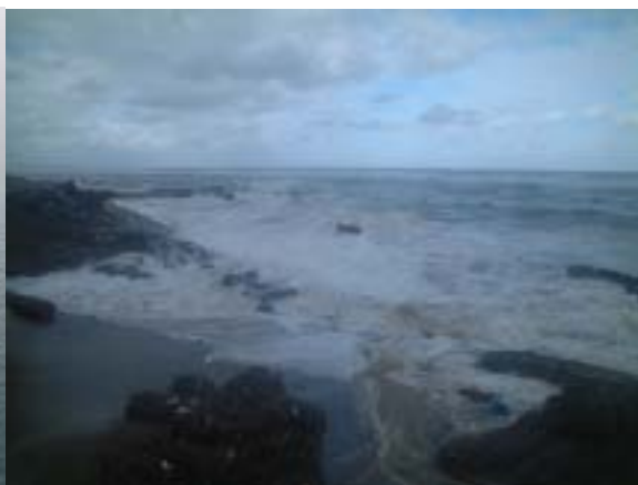
平成16年8月19日台風15号 被災状況