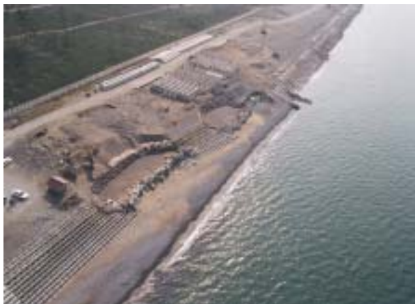
平成16年度補正予算 施工箇所 【小松市安宅新地先】(平成16年11月撮影)