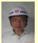
寺井建設(株) 大崎 監理技術者

本工事は、中地区において本線の掘削・盛土、擁壁を施工する工事です。工事期間中は、近隣の皆様にご迷惑をお掛けしますが、無事故・無災害で工事を終わられるよう努めてまいりますので、ご理解とご協力の程、宜しくお願い致します。