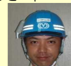
(株)宮地組 池下 監理技術者

本工事は、三井町小泉地先において本線の盛土工・擁壁工が主な工事となります。工事期間中、近隣の皆様方には、何かとご不便ご迷惑をお掛け致しますが、安全第一で工事を進めてまいりますので、皆様方のご理解ご協力をいただけますようお願い致します。