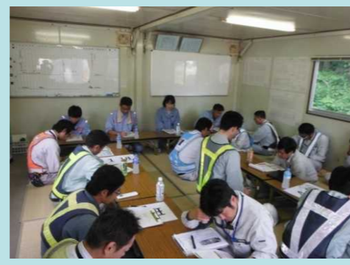
穴水労働基準監督署による労働災害・熱中症対策の講話