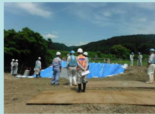
転落防止施設の設置状況を確認