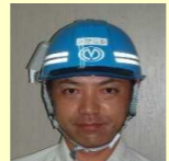
榎宮地組 池下 監理技術者

本工事は、昨年4月より16ヶ月間、三井町中地区において、本線の盛土・切土（掘削）工事、ボックスカルバート工を進めてまいりました。工事期間中、地域の皆様には工事に関わる多くの大型車両の通行にご協力いただき、ありがとうございました。おかげさまで無事故・無災害で工事を終えることができました。心より感謝申し上げます。