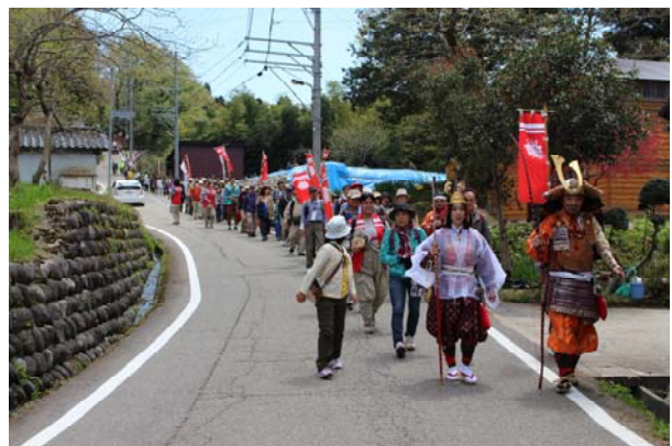
【「くりから夢街道ウォーク」の状況】