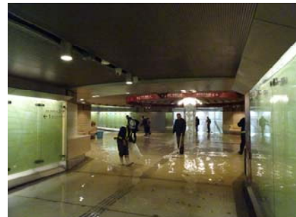
【漏水時のむさしクロスピアの様子】

関連URL：記者発表資料 http://www.hrr.mlit.go.jp/kanazawa/mb5_kouhou/press/h29/p0406_1.pdf