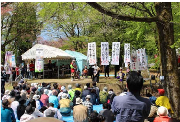
【義仲・巴くりから座による寸劇の様子】

俱利伽羅峠は、源平合戦の「火牛の計(かぎゅうのけい)」に関わる史跡や加賀藩の参勤交代の街道としての利用など、その歴史的・文化的価値が高いことから、平成7年6月に歴史国道に指定しました。翌年の平成8年から歴史国道イベントが始まり、今年で21回目となります。