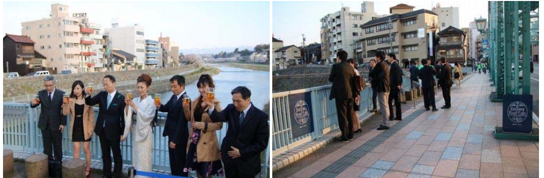
【「犀川リバーカフェ」の様子】