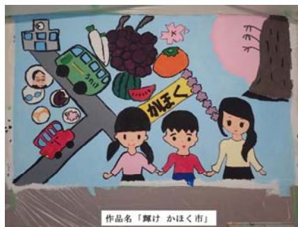
作品名「輝け かほく市」