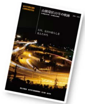
【山側環状全線開通10年記念誌】