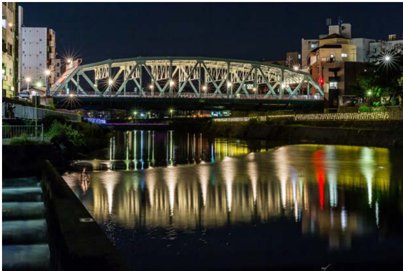
【「犀川大橋」前回ライトアップの状況】

金沢河川国道事務所では、国指定登録有形文化財でもある「犀川大橋」について、金沢のシンボルとして市民にも親しまれている長寿橋を再認識して頂くこと及び新たな魅力となるナイトカルチャーの充実や地域の賑わい創出を目指して、平成29年4月1日(土)から恒常的にライトアップを実施します。周囲が暗くなってから自動点灯し、24時頃までライトアップしています。