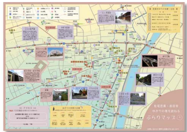
【完成したぶらりマップ】

関連URL：記者発表資料 http://www.hrr.mlit.go.jp/kanazawa/mb5_kouhou/press/h29/p0315_1.pdf