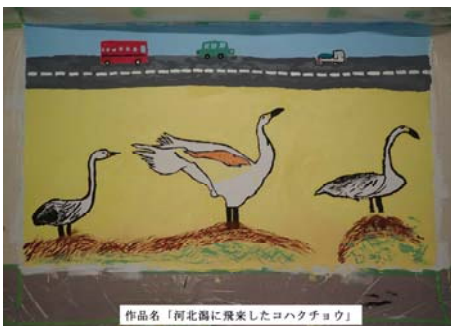
作品名「河北潟に飛来したコハクチョウ」

この取組は、横断地下道の環境整備を目的として、平成25年度より、地元住民・市・国が協同で実施しているものです。今年度については「河北潟に飛来したコハクチョウ」、「輝け かほく市」、「かほく市 MAP」をテーマに壁画制作を行いました。作品は縦1.1メートル×横2.0メートルの3枚の制作にチャレンジしました。