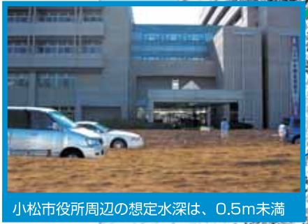
小松市役所周辺の想定水深は、0.5m未満