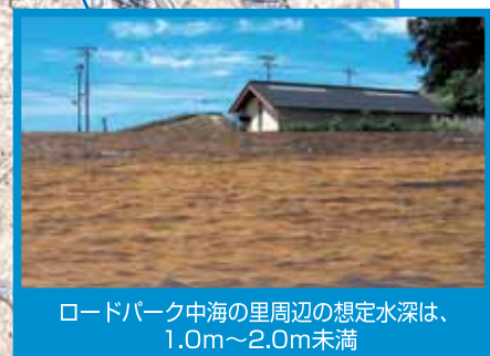
ロードパーク中海の里周辺の想定水深は、1.0m～2.0m未満