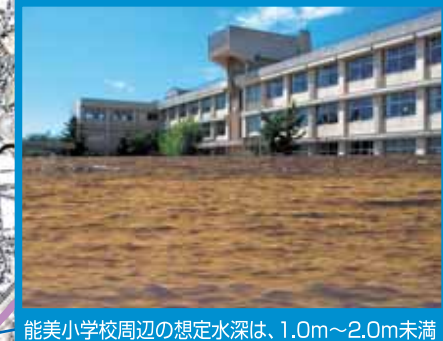
能美小学校周辺の想定水深は、1.0m～2.0m未満