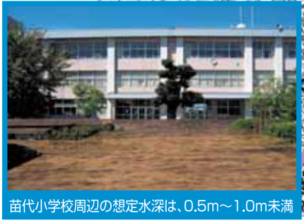
苗代小学校周辺の想定水深は、0.5m～1.0m未満