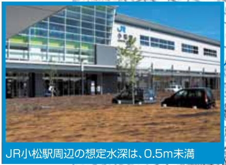
JR小松駅周辺の想定水深は、0.5m未満