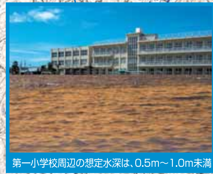
第一小学校周辺の想定水深は、0.5m～1.0m未満