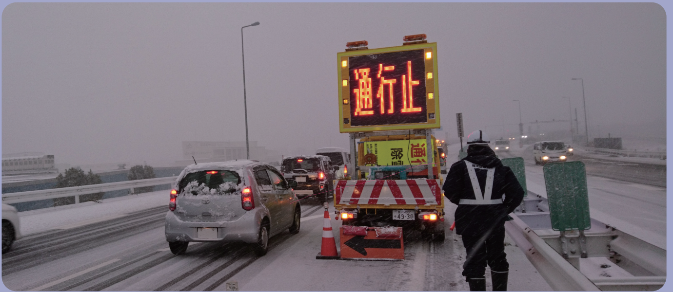
⑧ 津幡町舟橋JCT R5.1.24富山方面通行止め