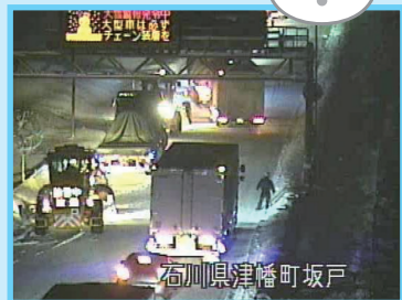
つばた さかど 津幡町坂戸R3.1.8大型車の立ち往生