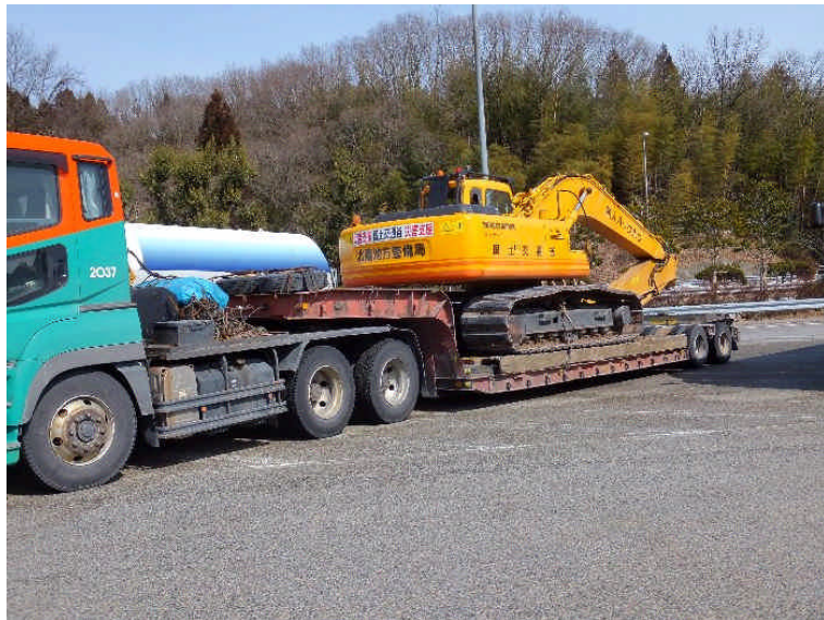
北陸道不動寺PAで合流 2/28(火)12:00