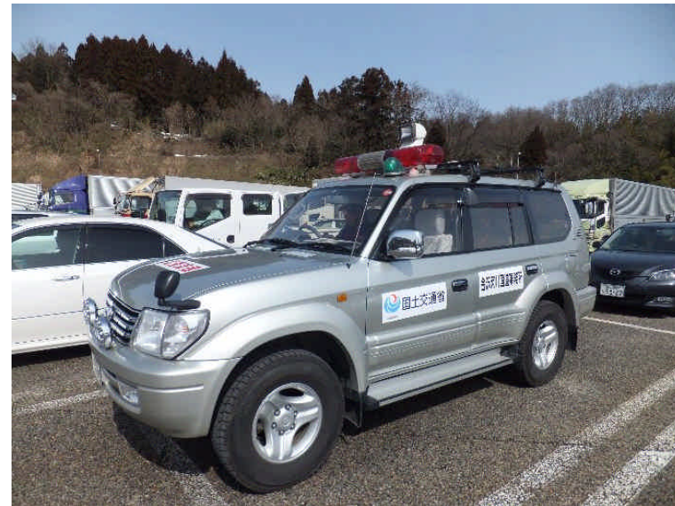
先導車 屋根に緑色回転灯設置