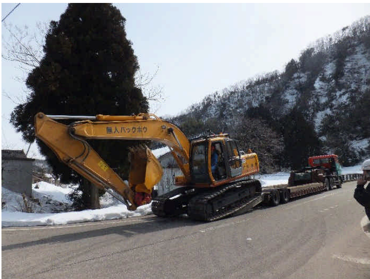
河合谷集落でトレーラより降車 2/28(火) 13:00