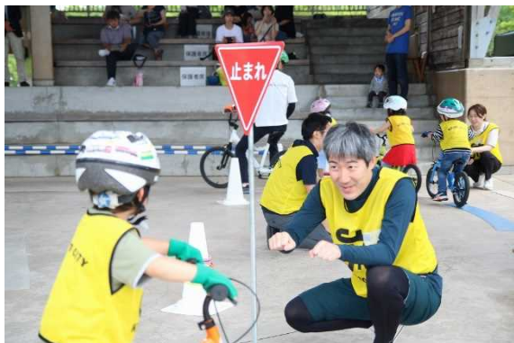
スタッフは子どもと目線を合わせる