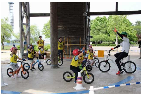
バタバタ(サドルに座ってバランスをとる)