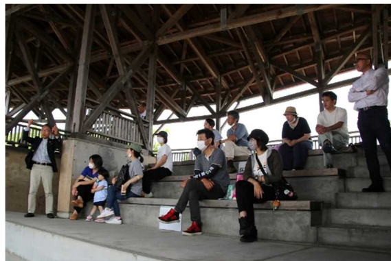
講師の説明を受ける保護者