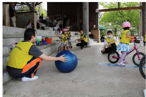
バランスボールをタイミング良く避ける