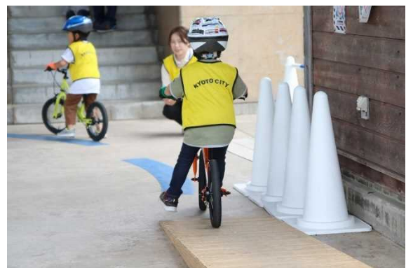
スロープ走行 (足を離して坂を下りる)