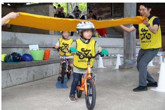
布をくぐり抜ける