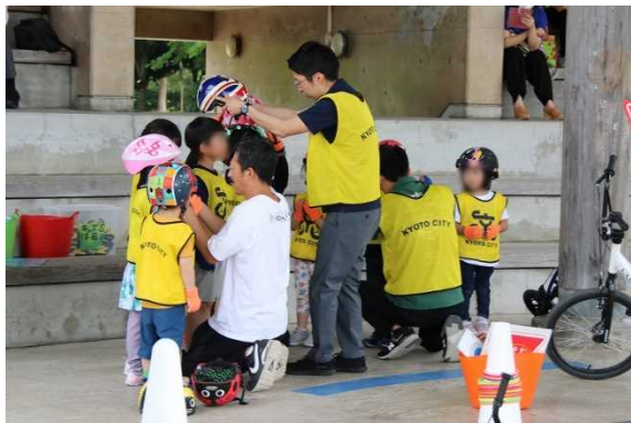
ヘルメットの着用