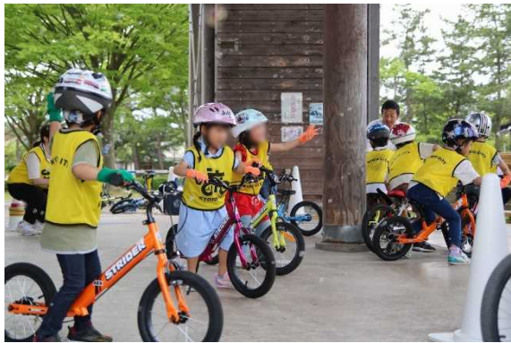
シャボン玉タッチ (アイスブレイク)