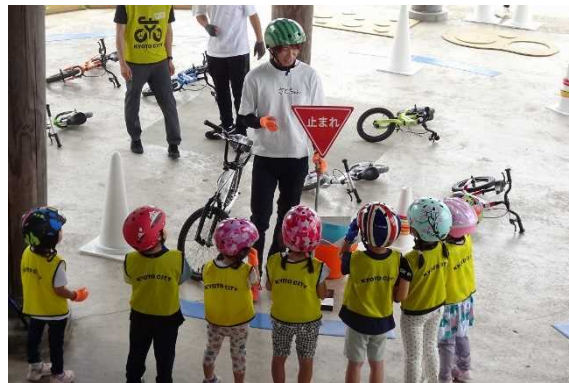
止まれ・信号の説明