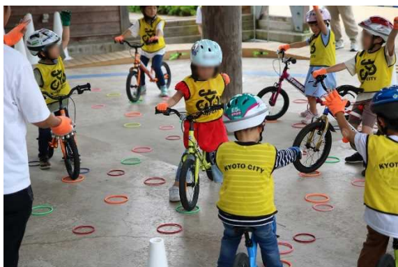
リングにタイヤ入れ