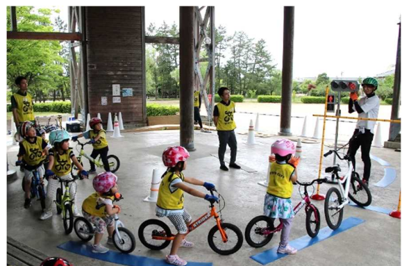
信号と左右の確認