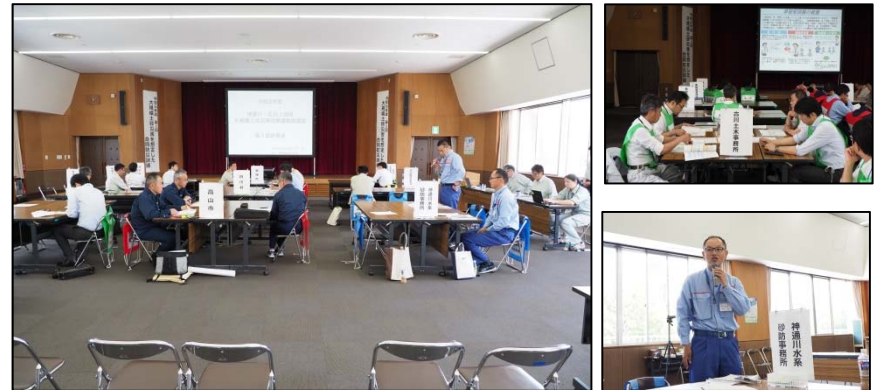
合同防災訓練の状況