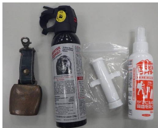
図 5 危険生物に関する安全装備

また、スズメバチ等は警戒音としてカチカチと音を立てている場合があり、近くに巣がある可能性が高い。このような場合には、速やかに立ち去ることを確認した。