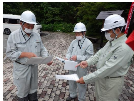
図 6 会話時のマスク着用