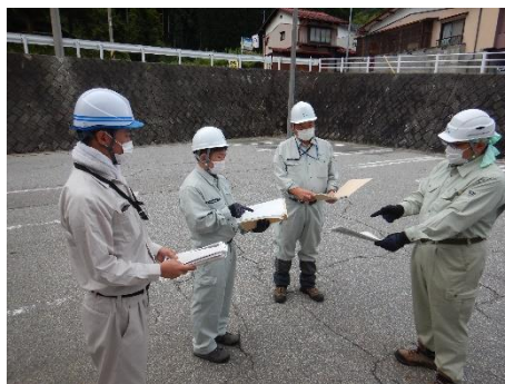
図 2 KY 活動の状況

事故リスクはその日の天候や体調、調査内容などによって異なるため、調査期間中においては調査開始前に KY 活動時を実施した。KY 活動は、現地調査計画書と KY 活動記録表を基に、作業内容、調査員の体調・装備、気象状況、緊急時の連絡体制、調査時の留意事項などを確認して調査を開始した。