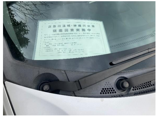
図 3 駐車時の連絡表示

車両を駐車する場合は安全が確保され、地元住民の通行の妨げにならない場所に駐車を行い、駐車車両の際には、見やすい場所に駐車票を設置し、調査車両であることがわかる掲示を行い、駐車によるトラブル防止に努めた。