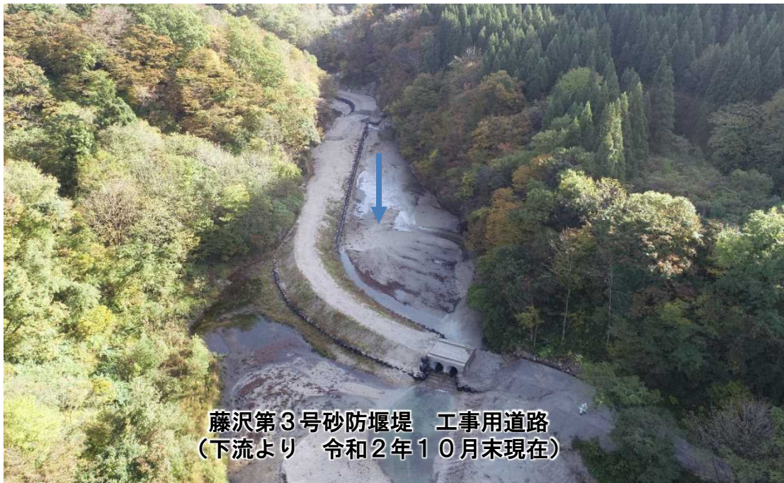
藤沢第3号砂防堰堤 工事用道路 (下流より 令和2年10月末現在)

(※現在は雪解け水による出水の際の被害軽減のため、工事用道路の一部を撤去しています)