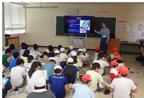
土砂災害についての説明 (令和元年9月 加治川小学校)