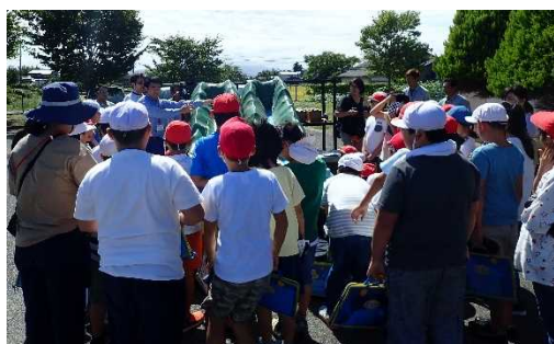
土石流模型実験装置による説明 (令和元年9月 加治川小学校)