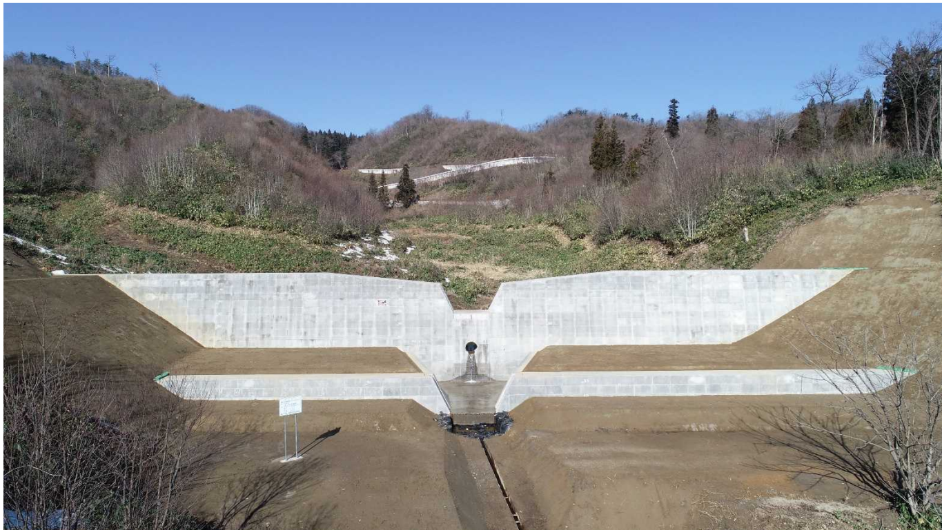
正面からの全景写真