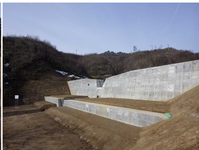
左岸側から全景写真