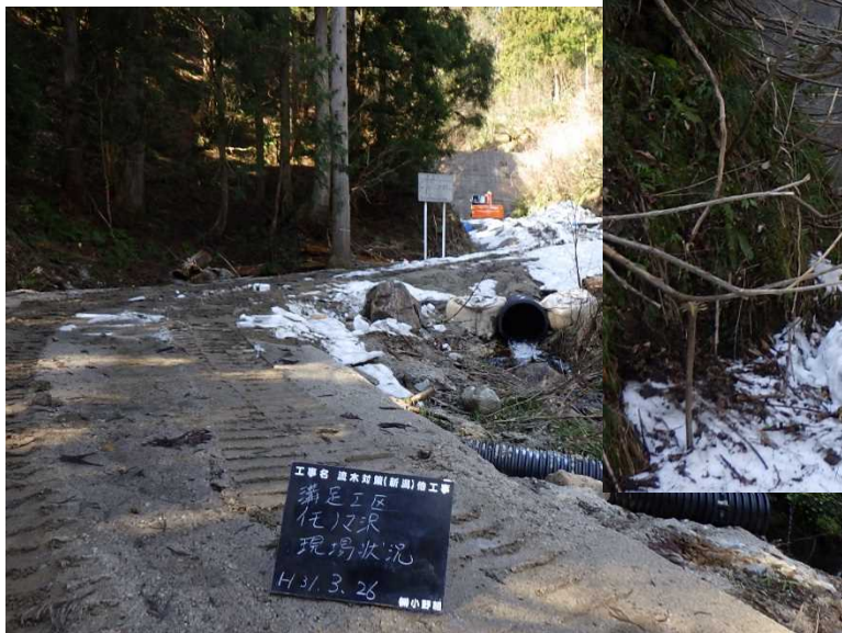
平成31年3月26日撮影 イモノマ沢砂防堰堤及び工事用道路の状況

工事は、積雪のため一旦中止していましたが、3月25日に再開しました。 除雪、工事用道路補修を行った後、流木対策工の設置にかかります。