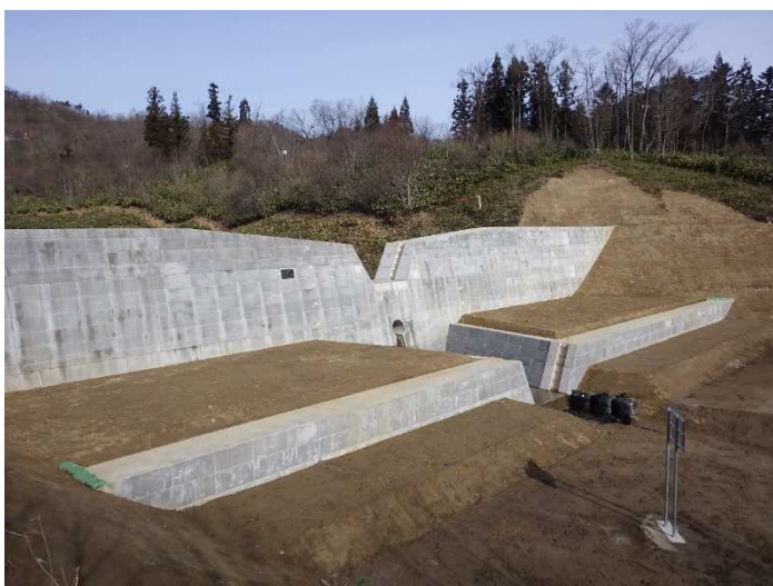
右岸側から全景写真