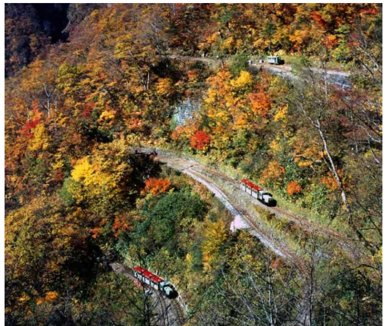
立山砂防工事専用軌道(トロッコ)