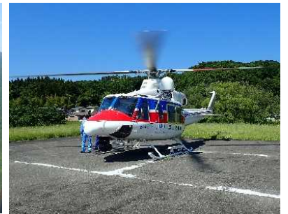
北陸地整防災ヘリ ほくりく号