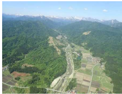
荒川上流域を望む

関係機関(管内市町村、警察、消防)と合同でヘリ調査を実施し、令和4年8月の大雨から1年が経過した管内の危険箇所等を上空から確認し、防災情報の共有を図ります。