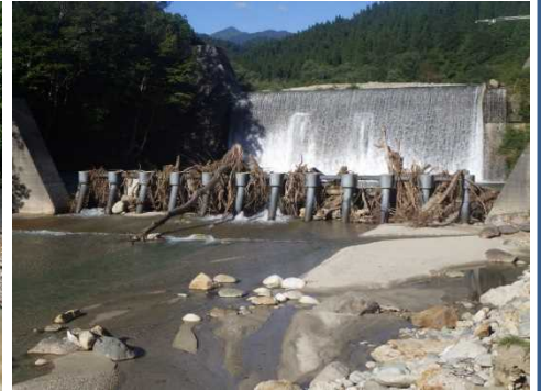
流木を捕捉した穴泷砂防堰堤