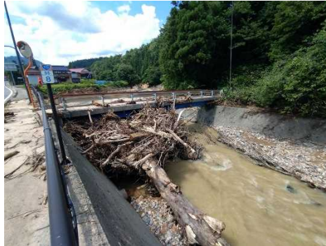
R4.8大雨での流木流出状況

令和4年8月の大雨では、管内各所において流木の流出が確認されています。また、未だ河道内に残っている流木もみられ、今後流木対策を強化していく必要があります。このような状況を鑑みて、飯豊山系砂防事務所、森林管理署が連携し今後の荒川流域における流木対策を強化するため、スタートラインとして勉強会を開催します。