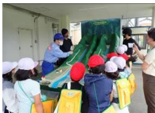
【参考】土石流模型実験装置による説明