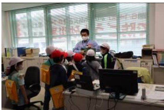
【参考】関川砂防出張所の説明

※「村のすてき調査隊」は、生活科「村探検」授業の一環と聞いています。詳細については関川小学校へお問い合わせ願います。