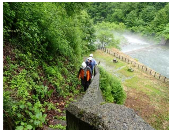
梅花皮沢第4号砂防堰堤 点検状況