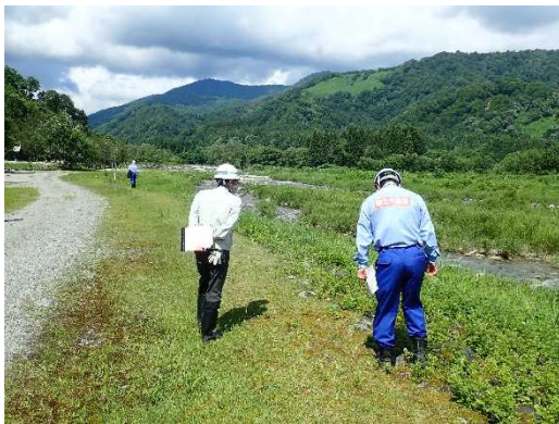
荒川流路工 護岸部 点検状況