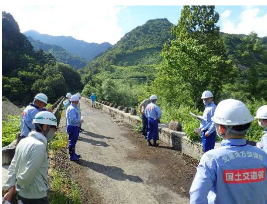
玉川スーパー暗渠砂防堰堤 点検状況