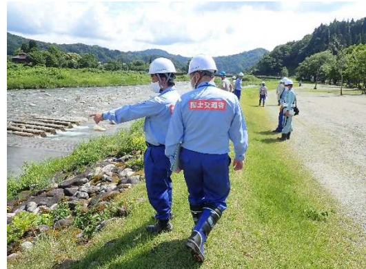
荒川流路工 護岸部 点検状況