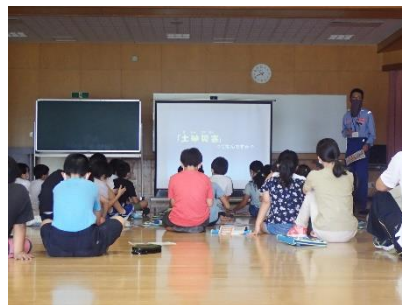
【参考】土砂災害についての説明（令和3年9月 加治川小学校）