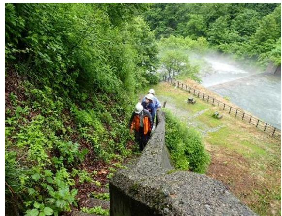
梅花皮沢第4号砂防堰堤 点検状況