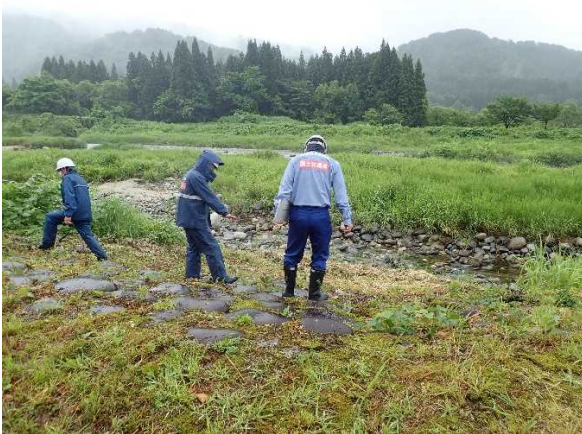
荒川流路工 護岸部 点検状況