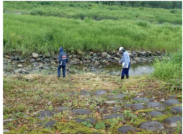
荒川流路工 護岸水際部 点検状況