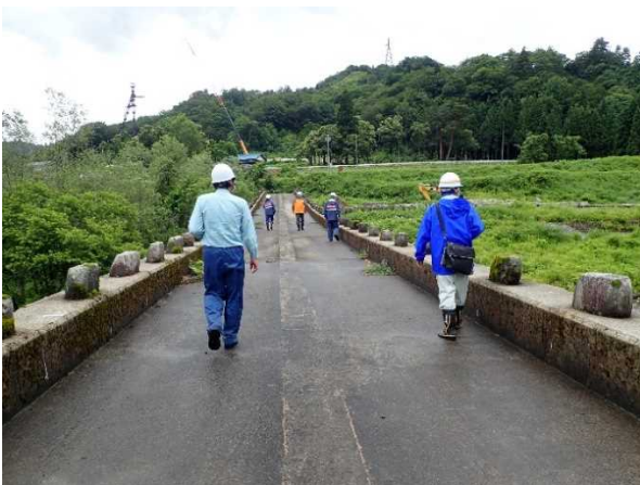
玉川スーパー暗渠砂防堰堤 点検状況