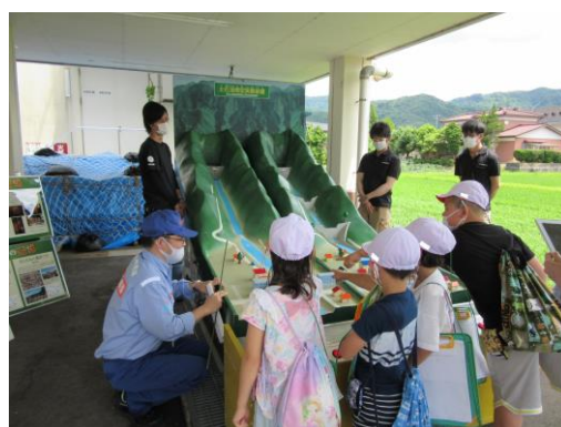
【参考】土石流模型実験装置による説明