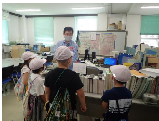
【参考】関川砂防出張所の説明

※「村のすてき調査隊」は、生活科「村探検」授業の一環と聞いています。詳細については関川小学校へお問い合わせ願います。