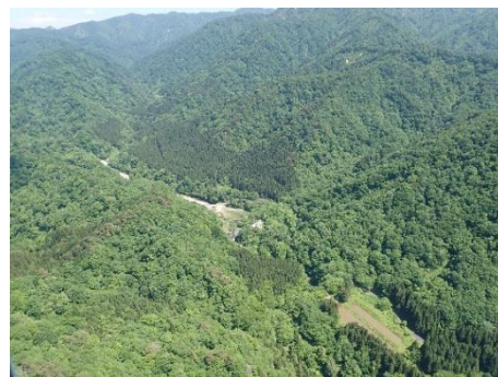
藤沢川上流部(荒川流域)