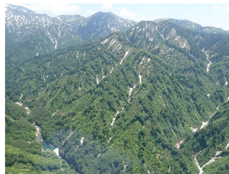
加治川上流部(加治川流域)