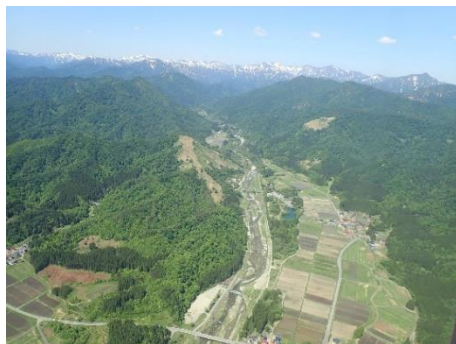
荒川上流部(荒川流域)