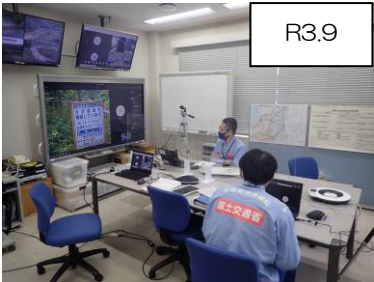
令和3年度の訓練実施状況イメージ

※発熱などの症状がある方は来場をお控えください。 また、新型コロナウイルス感染防止対策の観点から、庁舎内でのマスクの着用をお願いします。皆様のご理解とご協力の程よろしくお願い申し上げます。