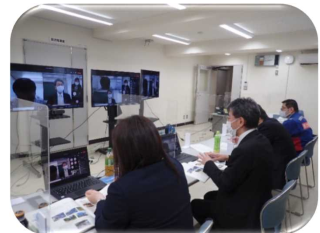
事務所運営の様子